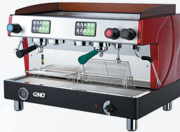
TTC -822 2頭機：2茶2咖