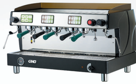
TTC -832 3頭機：3茶 2咖