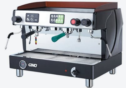
TTC -812 2頭機：1茶2咖