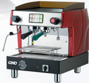
TTC -811 單頭機：1茶1咖