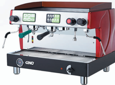
TTC -821 2頭機：2茶1咖